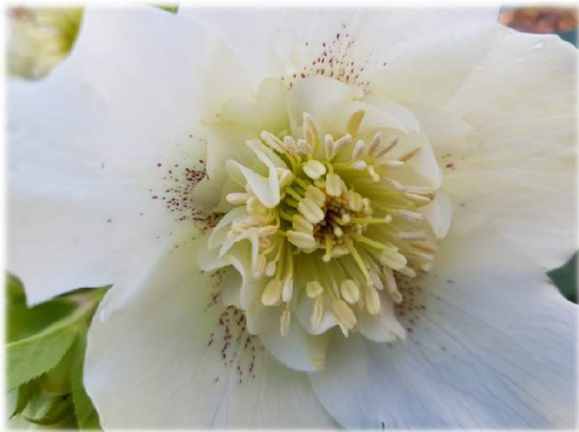
'Anemone Guttatus White' n°25