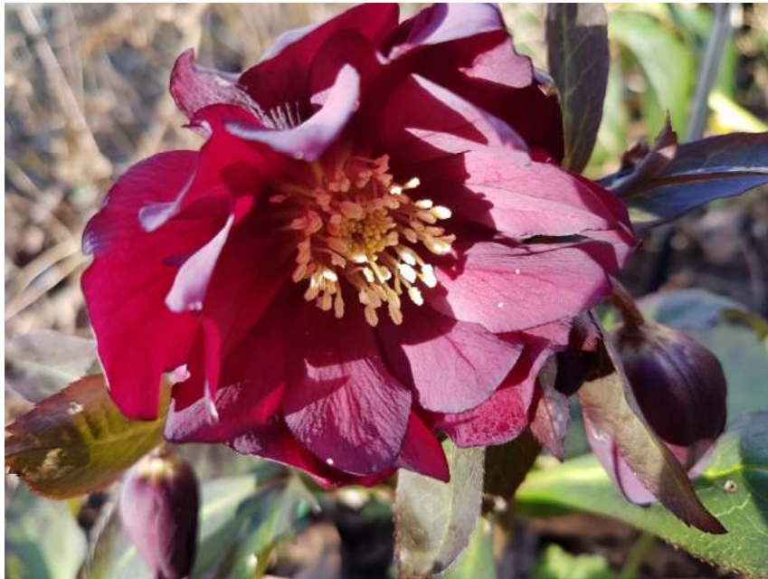
'Double Red' WS n°94