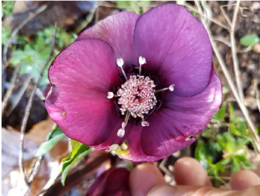
'Red Eye' WS n°60