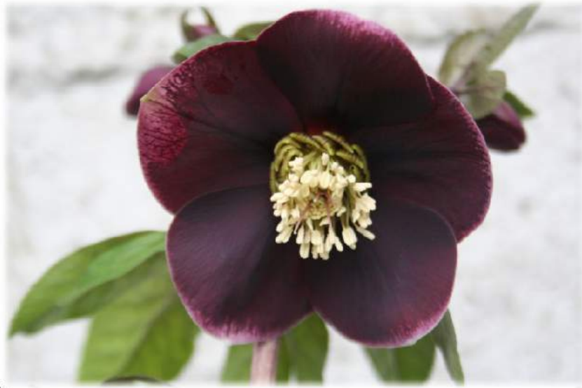
'Aubergine with White Edge' WS n°38