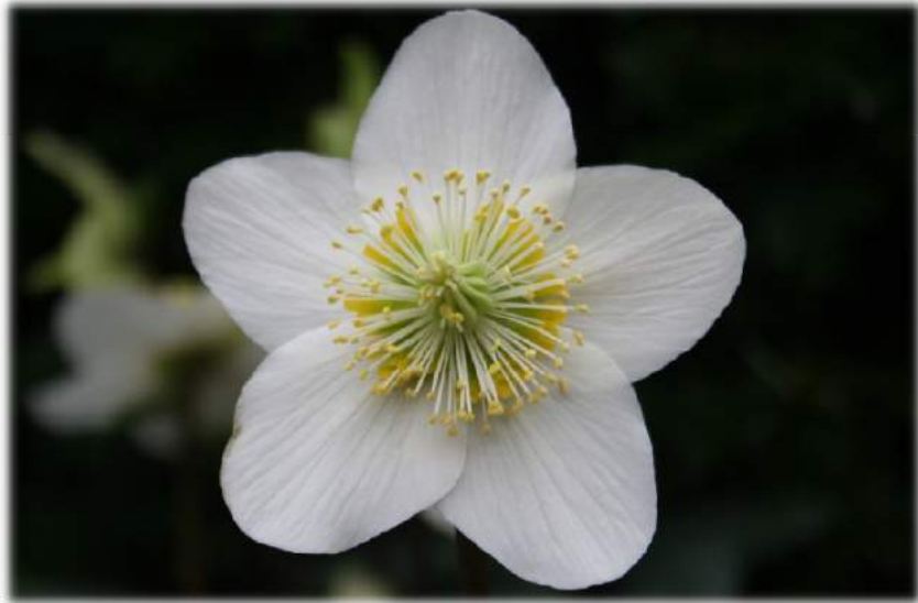
HGC® 'Jacob Royal' n°15