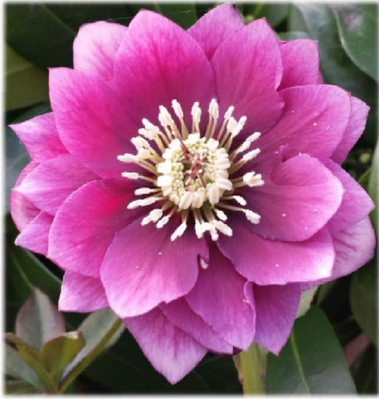
'Double Pink' WS n°92