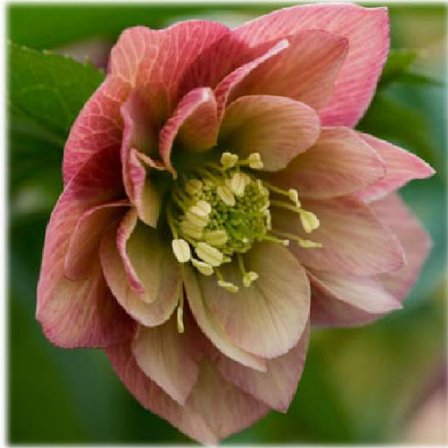
'Double Apricot' WS n°82