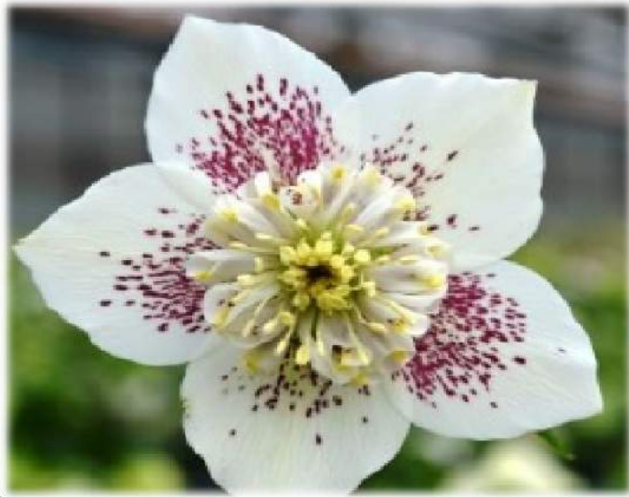
'Anemone White Spotted' WS n°33