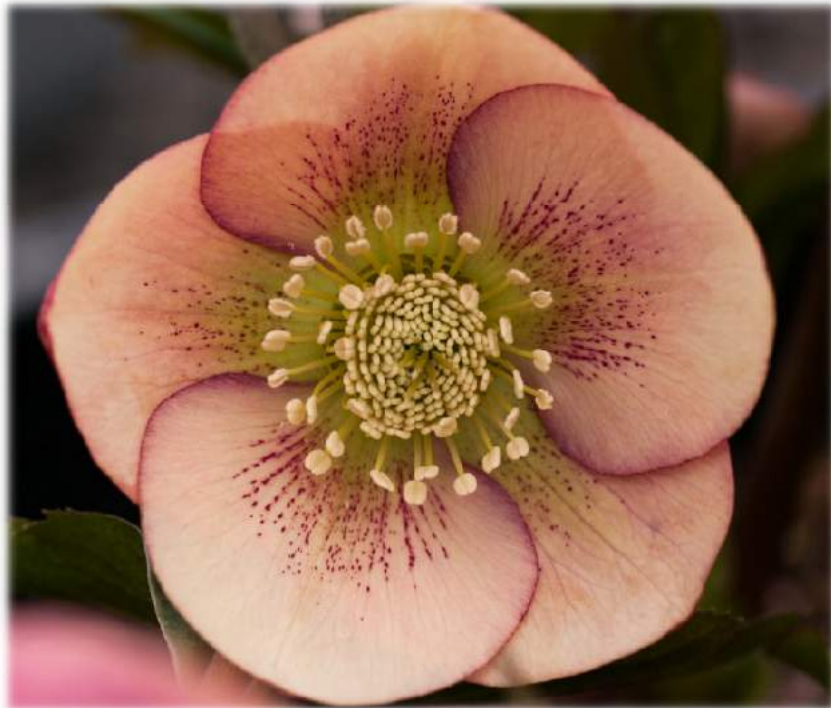
'Apricot Spotted' WS n°74