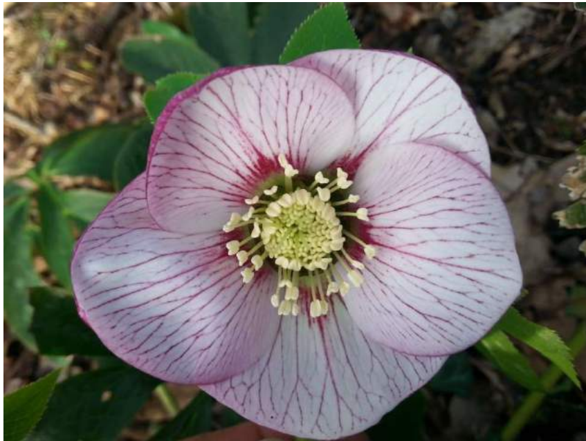
'Peach Spotted' WS n°76