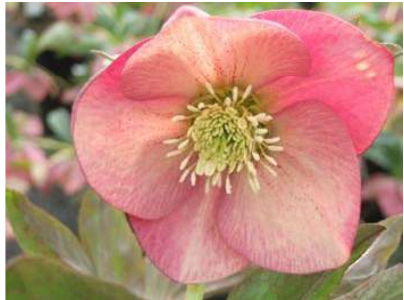
'Peach' WS n°53