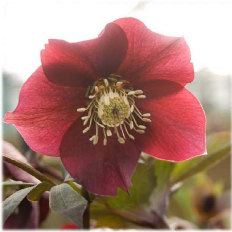
'Anemone Red' WS n°31