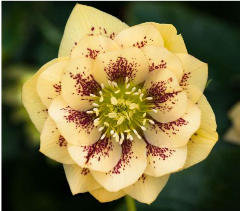
'Double Yellow Spotted' WS n°101