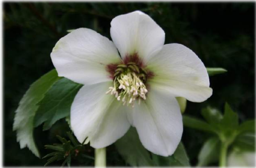
'White with Red Center' WS n°72