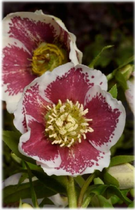
'White Spotted' WS n°80