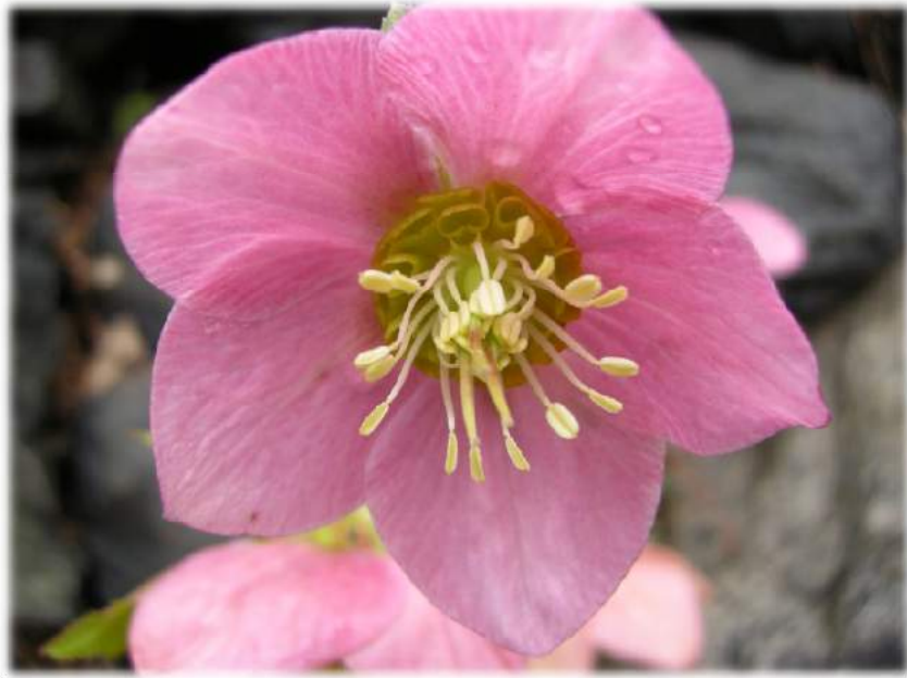
'Pink' WS n°56