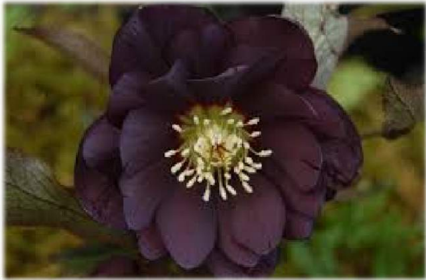
'Double Dark' WS n°87