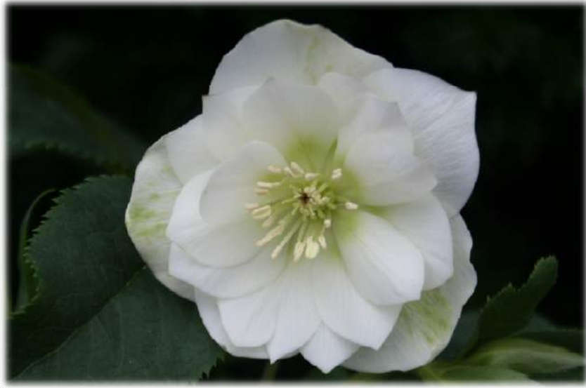
'Double White 'WS n°96