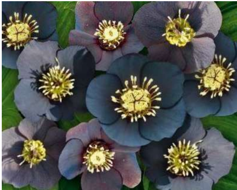
'Magic Black' WS n°46