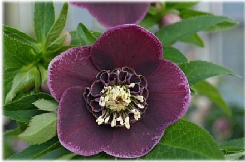
'Anemone Aubergine with White Edge' WS n°23