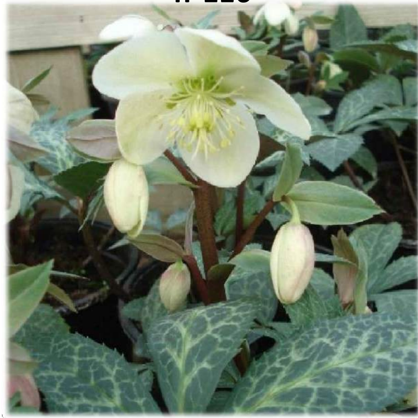
xnigercors 'Magic Leaves' © n°116