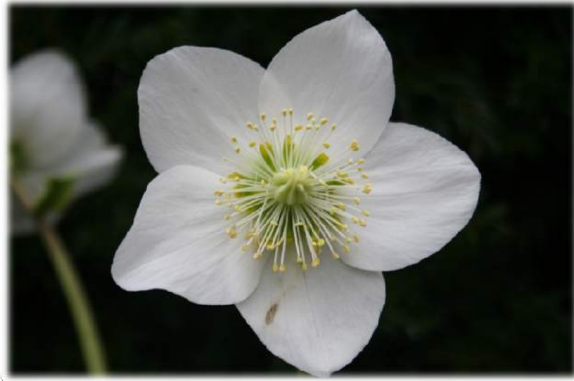
HGC® 'Josef Lemper' n°17