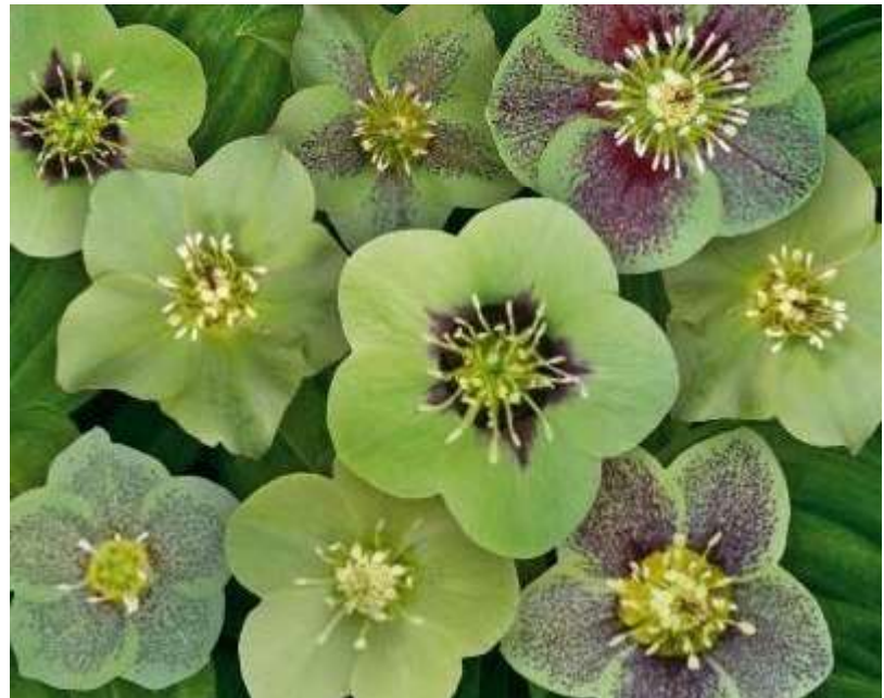
'Magic Green ' WS n°47