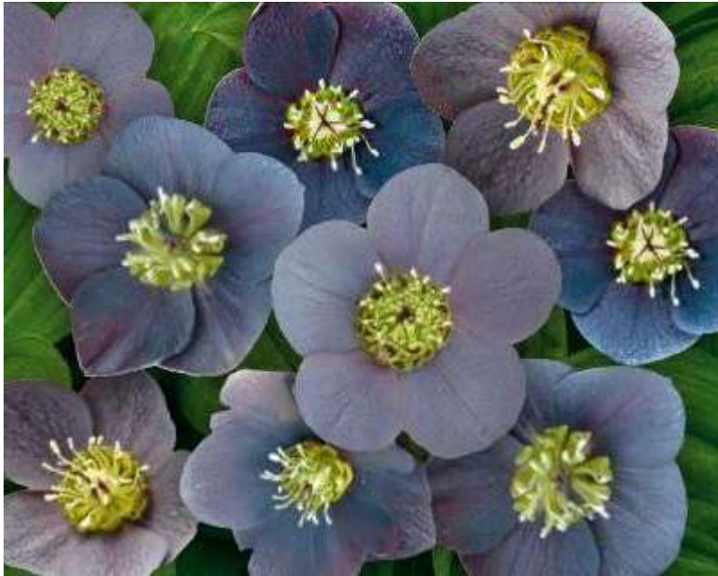
'Magic Slaty Blue' WS n°50