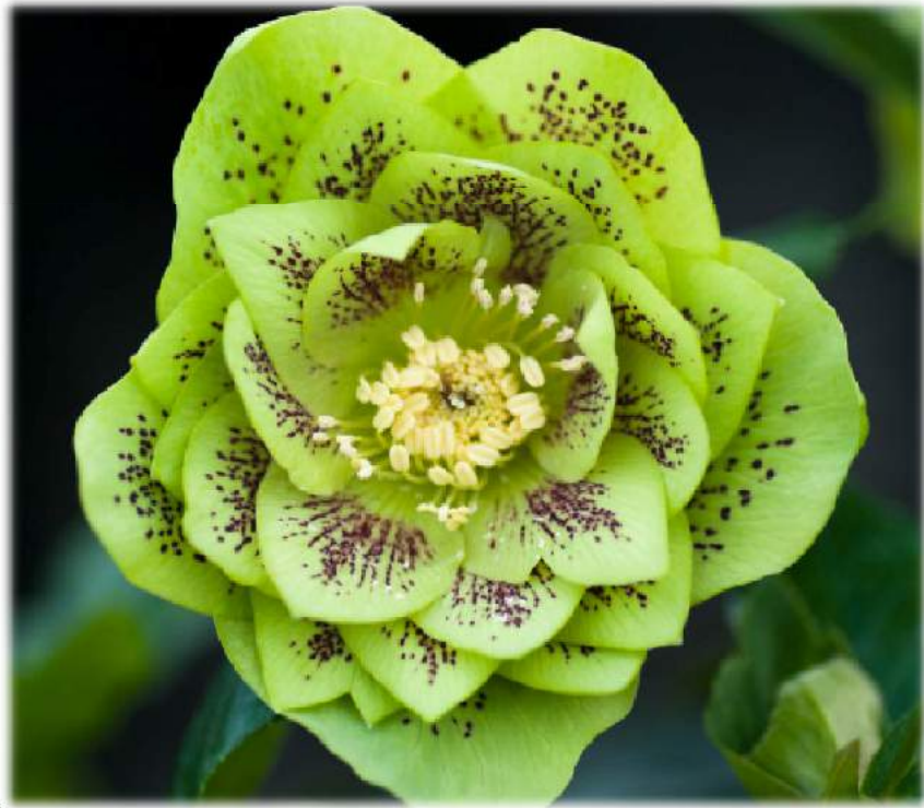
'Double Green Spotted' WS n°99