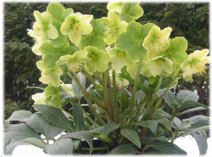
xnigercors 'Snow Love'© WINTER MAGIC n°118