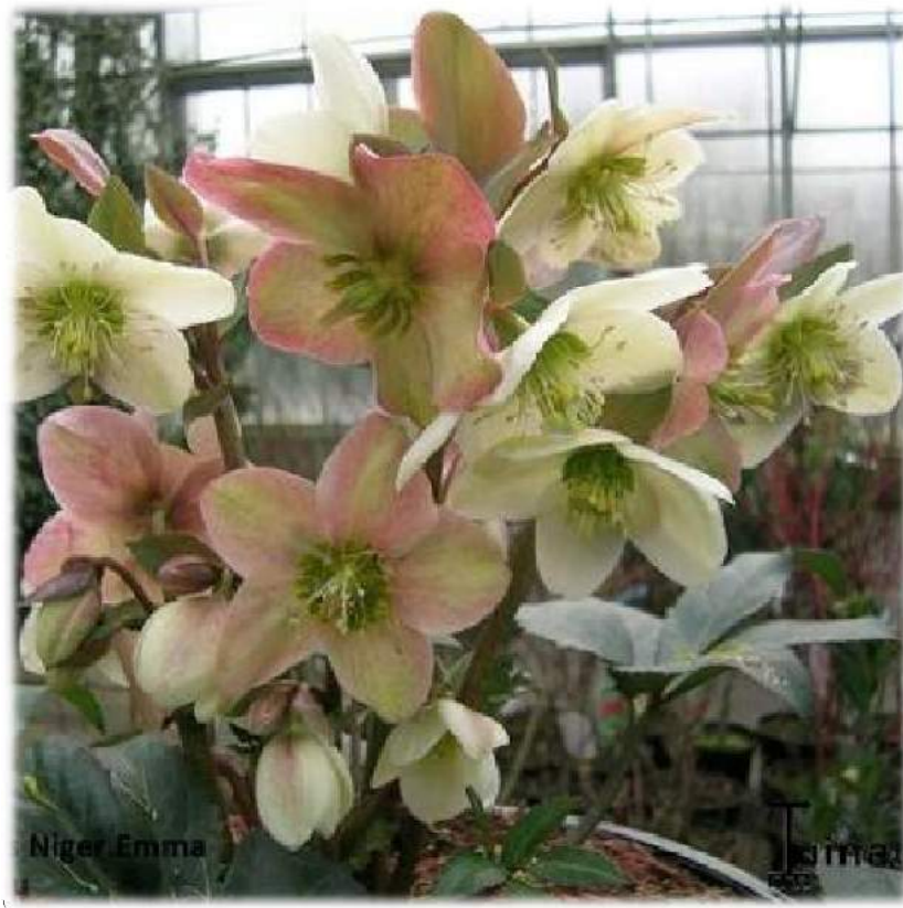
x 'Anna' n°121