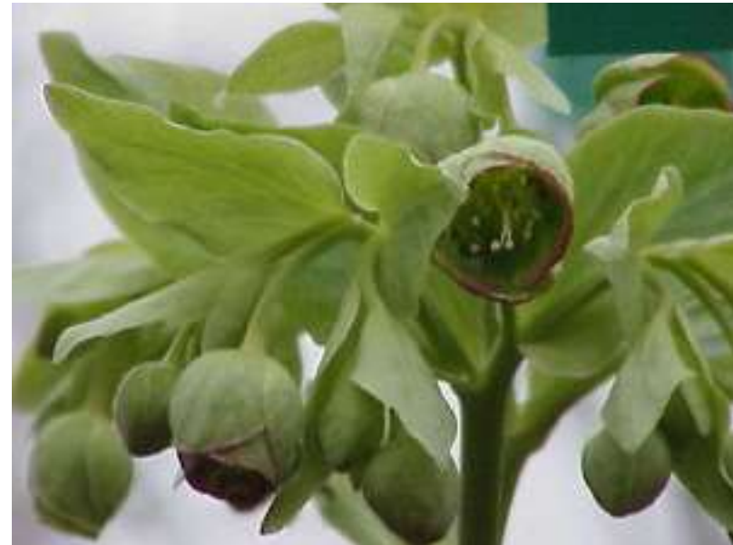
'Miss Jeckyll's' n°10