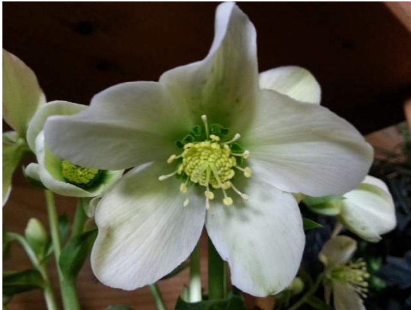
xnigercors 'Winter Passion' n°119