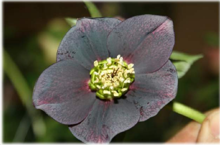
'Slaty Blue' WS n°62