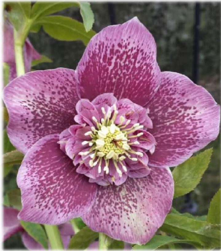
'Anemone Pink Spotted' WS n°29