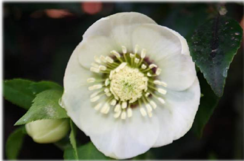
'White' WS n°70