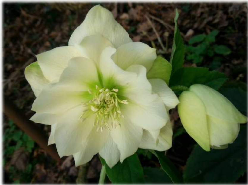
'Double Creme' WS n°85