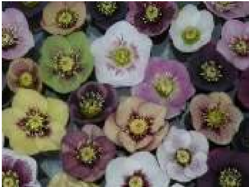
'Mixed Colours' WS n°52