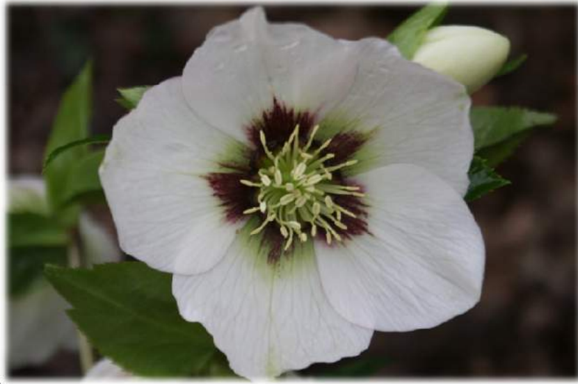
'Creme with Red Center' WS n°40