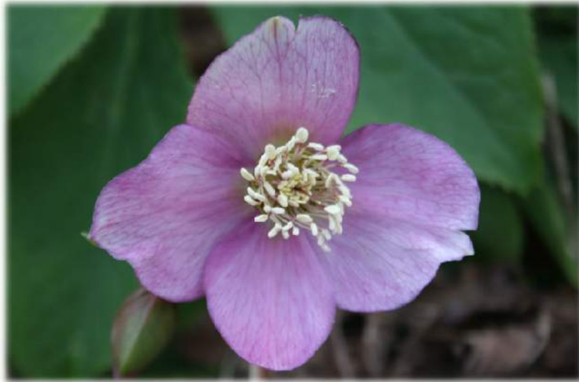
'Pink Spotted with Green Center' WS n°78