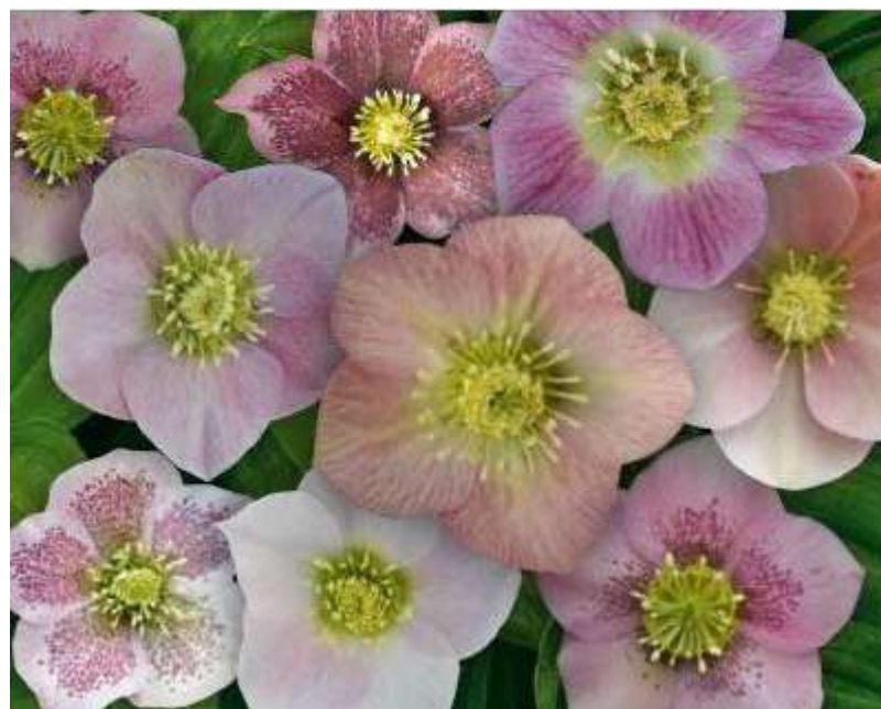
'Magic Pink ' WS n°49