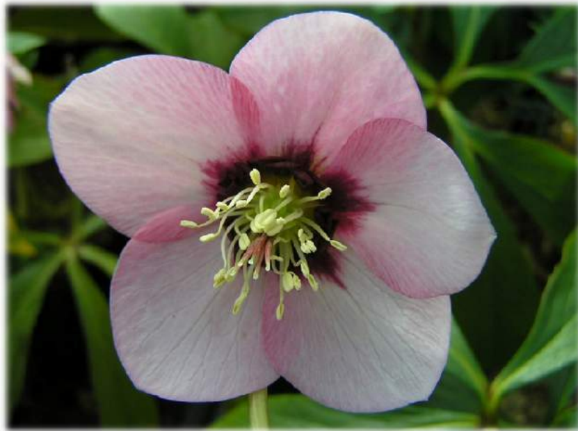
'Peach with Red/Dark center' WS n°54