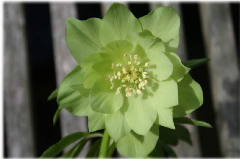
'Double Green' WS n°89