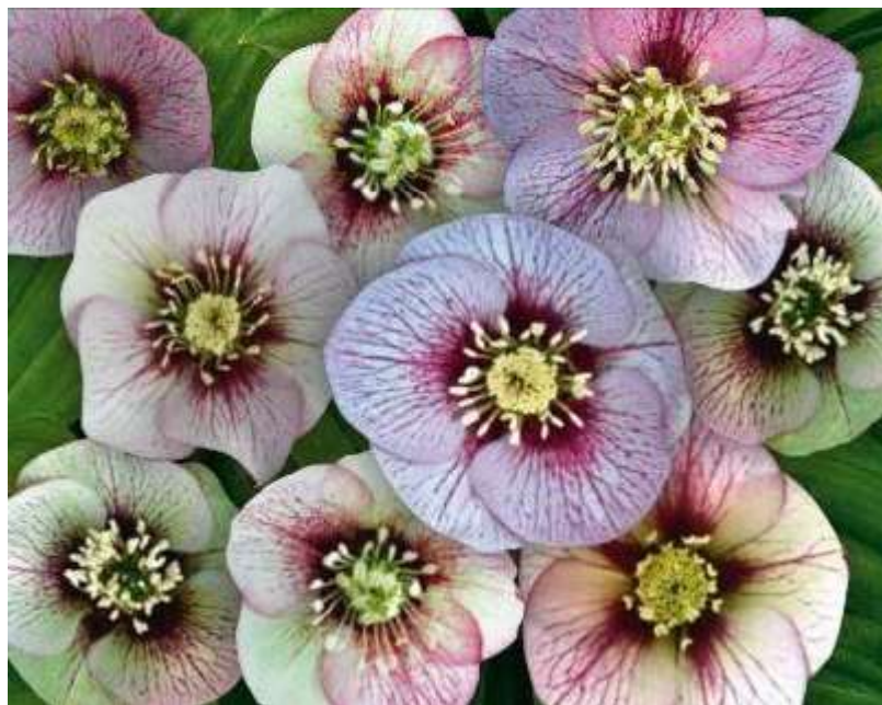
'Magic Picotee' WS n°48