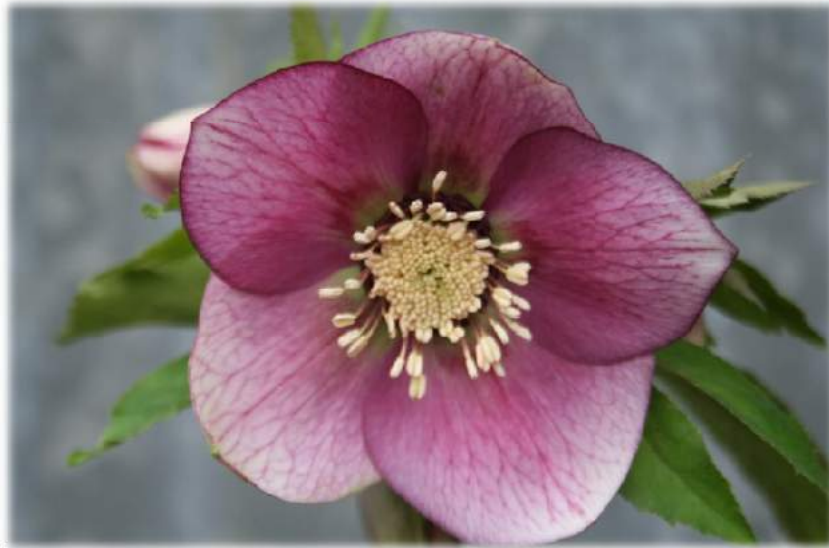
'Fuschia' WS n°42