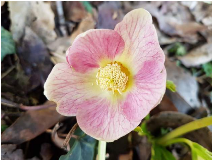
'Special Pink' WS n°64