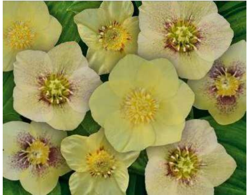
'Magic Yellow' WS n°51