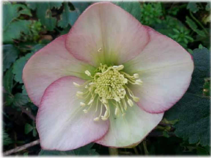
'Apricot' WS n°36