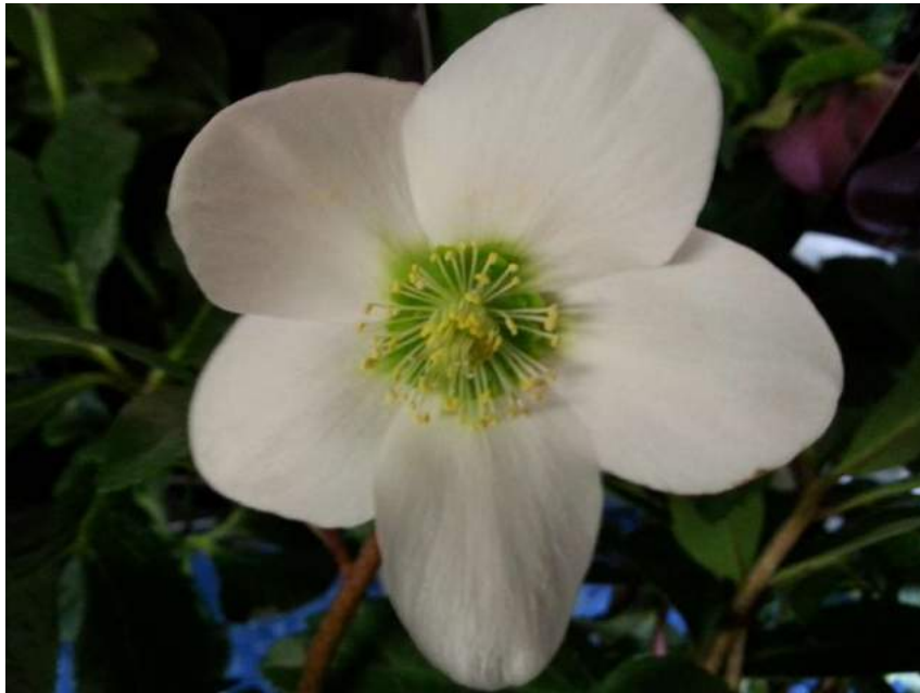
'Mont Blanc' n°19