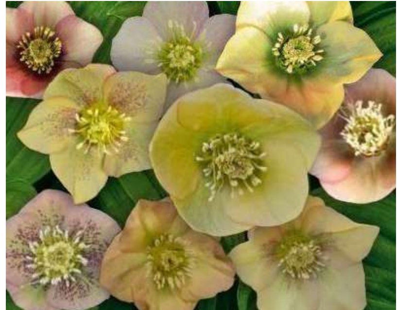
'Magic Apricot' WS n°45