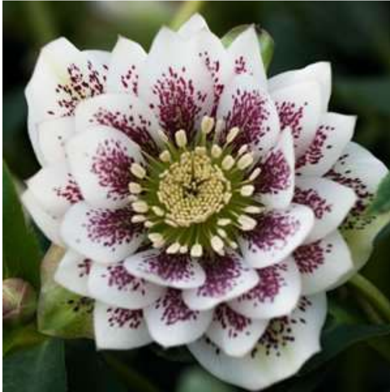
'Double White Spotted' WS n°103