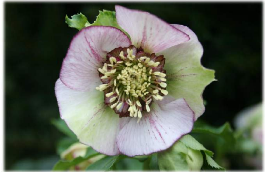
'Anemone Picotee' WS n°28